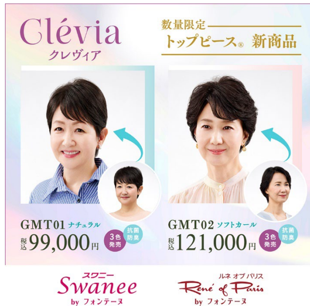
(左) GMT01(カラー:F2B)、(右) GMT02(カラー:F2B)着用イメージ

毛髪・美容・健康・医療のウェルネス事業をグローバル展開する株式会社アデランス(本社:東京都品川区、代表取締役社長 鈴木 洋昌)は、GMSで展開する女性用レディメイド・ウィッグ(既製品)ブランド「スワニー by フォンテーヌ」、「ルネ オブ パリス by フォンテーヌ」のショップにて、新ブランド「Clévia(クレヴィア)」からトッピーズ®『GMT01』と『GMT02』を4月10日(金)に新発売します。