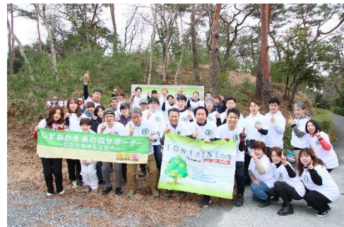
当社看板の前での記念撮影

今年度は、昨年を上回る 38 名の参加者数となり、うち初参加が 9 名となりました。参加者は植樹方法を教わり、木の根が張る森林の斜面を掘り返しながらアカマツの苗木を 100 本植樹しました。2009年の植樹開始から 14 年で累計植樹本数は 1,705 本、環境保全面積は累計で 26,889 m 2 （東京ドーム半分以上の面積）となり、活動の範囲も年々増しています。