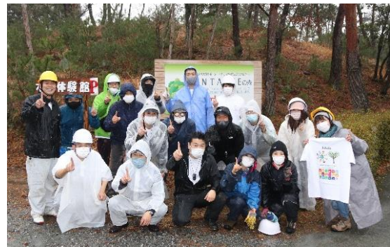
当社看板の前での記念撮影

今年度は、両日ともに雨が降る中、手指消毒などの感染症対策をしっかりと行い、12月に地ならし、1月に苗木の植樹を少人数の有志で実施しました。1月の植樹では約900平方メートルの土地に横浜ゴム新城工場で作られた苗木140本を当社社員が1つ1つ丁寧に植樹を行いました。