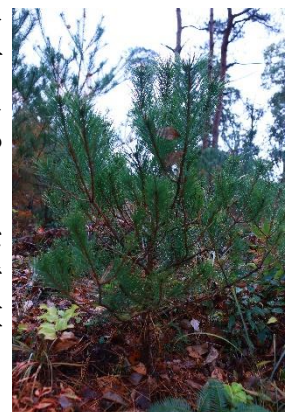
2020年1月に植樹したアカマツ林

2020年1月に植樹をした苗木は、枝の数を増やし、添え木がなくても、大きく成長を続けていました。元通りの景観に戻るまでには時間を要しますが、SDGs・CSR活動の一環として、継続的に植樹を行って参ります。