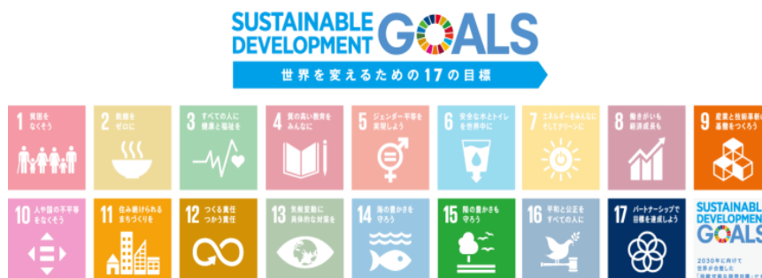
本活動の関連するSDGs目標を上記に表示します

アデランスグループは、グローバルに事業を展開する企業として、SDGsで掲げられる、世界が直面するさまざまな課題と真摯に向き合い、事業を通じた社会課題の解決を図ることで、持続可能な社会の実現に寄与し、持続的な成長を目指してまいります。