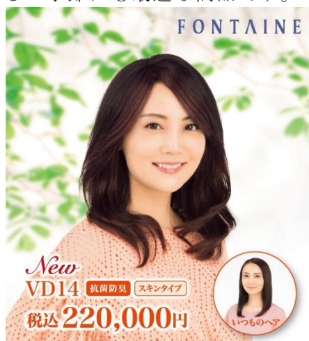
VALAN Cool. (VD14)

「VALAN PREMIUM®」は、高度な形状保持性を備えた合成繊維と人毛をミックスした毛材を採用し、高いスタイルキープ力とスタイリングのしやすさが特徴のプレミアムなシリーズです。今回発売する新作ハーフウィッグ(VPD100)は、様々なシーンでお使いいただけるショートソフトカールスタイル。ベースネット本体とスキン(人工皮膚)ネットを一体形成した特許取得のベースネット(特許第6177407号)を採用し、軽いつけ心地を実現しました。防臭抗菌とUVカット加工を施しており、日差しの強いこれからの季節にも最適な商品です。