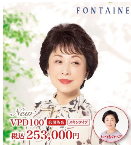
VALAN PREMIUM. (VPD100)