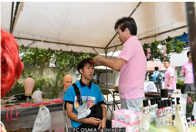
ヘアエクステンションを施す様子

当社のブースでは、ご来場のサポーターの皆さんに当社の医療事業に関する活動をまとめた冊子、コンパクトミラー、爪やすりを進呈すると共に、希望者にはピンク色のヘアエクステンション（付け毛）を当社の技術者がお一人おひとりにお着けしました。更に、募金を行っていただいた方へ、当社オリジナルのピンクリボンバッチを進呈しました。募金活動で集まったお金は、特定非営利活動法人ピンクリボン大阪へ寄付しました。