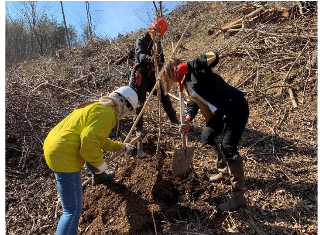
当社社員による植樹の様子

当社では、使われなくなったウィッグの回収と環境保全とをつなげる「フロンテージュ緑の森キャンペーン」を、2009年から実施しています。本キャンペーンの一環として、東北エリアでは「さくら並木ネットワーク」を通じ、2017年に東日本大震災の被災地である石巻市大谷川高台移転地、2018年には石巻市給分地区に桜の木の植樹を行ってきました。世代を超え、代々語り継ぎ、いのちを守りたいとの思いに賛同し、震災の大津波到達地点に桜を植樹しています。