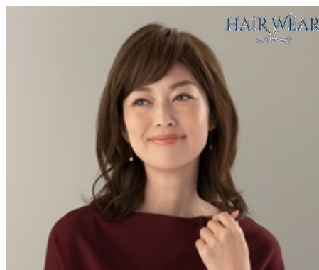
「HAIR WEAR®」 バングウィッグ