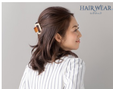
「HAIR WEAR®」 パーツウィッグ

「HAIR WEAR®」は、髪の悩みが変わり始める40代～50代の大人女性に向けて、「ファッション感覚で『手軽』にヘアアレンジを楽しむ」をコンセプトに、髪の悩みをオシャレに解決するウィッグを提供します。後頭部をふんわりボリュームアップさせる「パーツウィッグ」（4,800円/税別）と、前髪が作れて白髪もカバーできる「バングウィッグ」（18,000円/税別）の2商品で展開します。