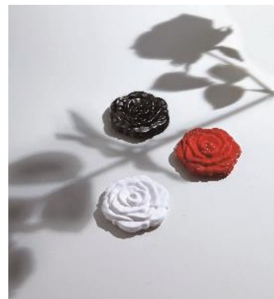
コンパクトミラー