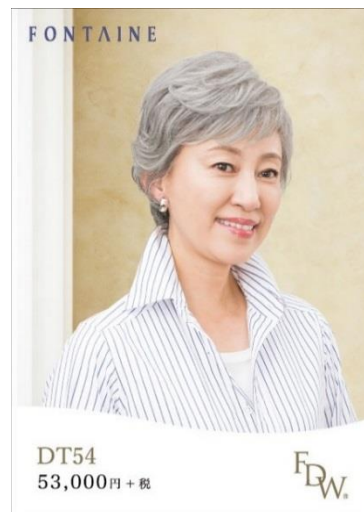
グレイヘアのトップピース (DT54)

新発売するグレイヘアウィッグは、頭全体を覆うタイプの「フルウィッグ」と頭頂部に装着するタイプの「トップピース（部分ウィッグ）」の2タイプです。