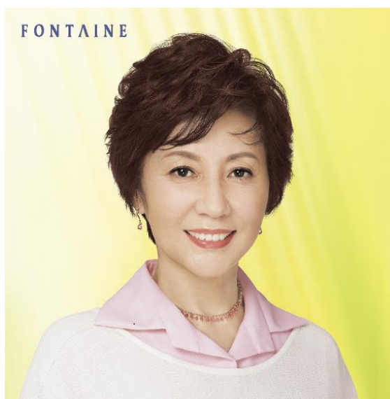
ヴァラン・新作トップピース (T30SP カラー：NF4)

また、「VALAN®」新作ウィッグの発売を記念し、リバティプリントを使用した「ヴァラン30周年記念トップピースケース」をプレゼントするキャンペーンを実施します。