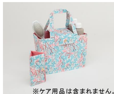
※ケア用品は含まれません。