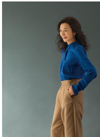
シフォレ ヴィヴィアン リーフレットより