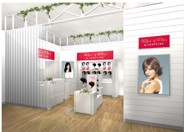
「ルネ オブ パリス by フォンテーヌ エムアイプラザ ひたちなか」 (イメージ図)

今回店舗を出店する「MI PLAZA ひたちなか」が入居する「ニューポートひたちなか ファッションクルーズ」は、館内にファッション、インテリア、レストラン、大型書店など約 100 の専門店を取り揃え、暮らしに便利なショッピングモールとして地域の方々に親しまれています。同店舗は、このような恵まれた立地条件を活かしながら、日々のコーディネートにプラスするだけで簡単にお洒落を楽しめるウィッグの魅力をお伝えしていきます。