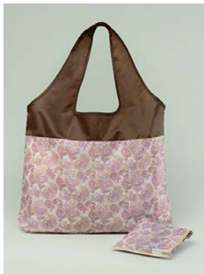
ご試着プレゼント 「オリジナル エコバック」

3 万円（税抜）以上ご購入上げのお客様に「オリジナル ジュエリーポーチ」をプレゼントします。（なくなり次第終了）