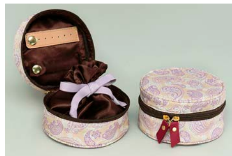
ご購入上げプレゼント 「オリジナル ジュエリーポーチ」