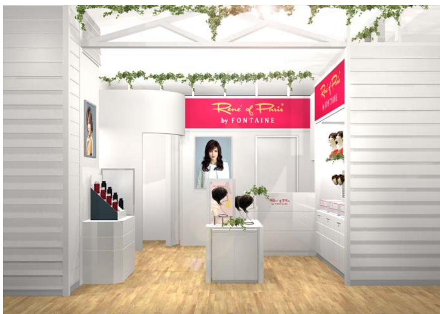
「ルネ オブ パリス by フォンテーヌ エムアイプラザ 釧路昭和」 (イメージ図)

釧路市は、北海道の東部、太平洋岸に位置し、「釧路湿原」「阿寒」の二つの国立公園をはじめとする雄大な自然に恵まれた街であり、東北海道の中核・拠点都市として社会、経済、文化の中心的な機能を担っています。同店舗は、このような立地条件を活かしながら、より多くの地域の方々に安心してご利用いただくためにサービスの向上を図っていきます。